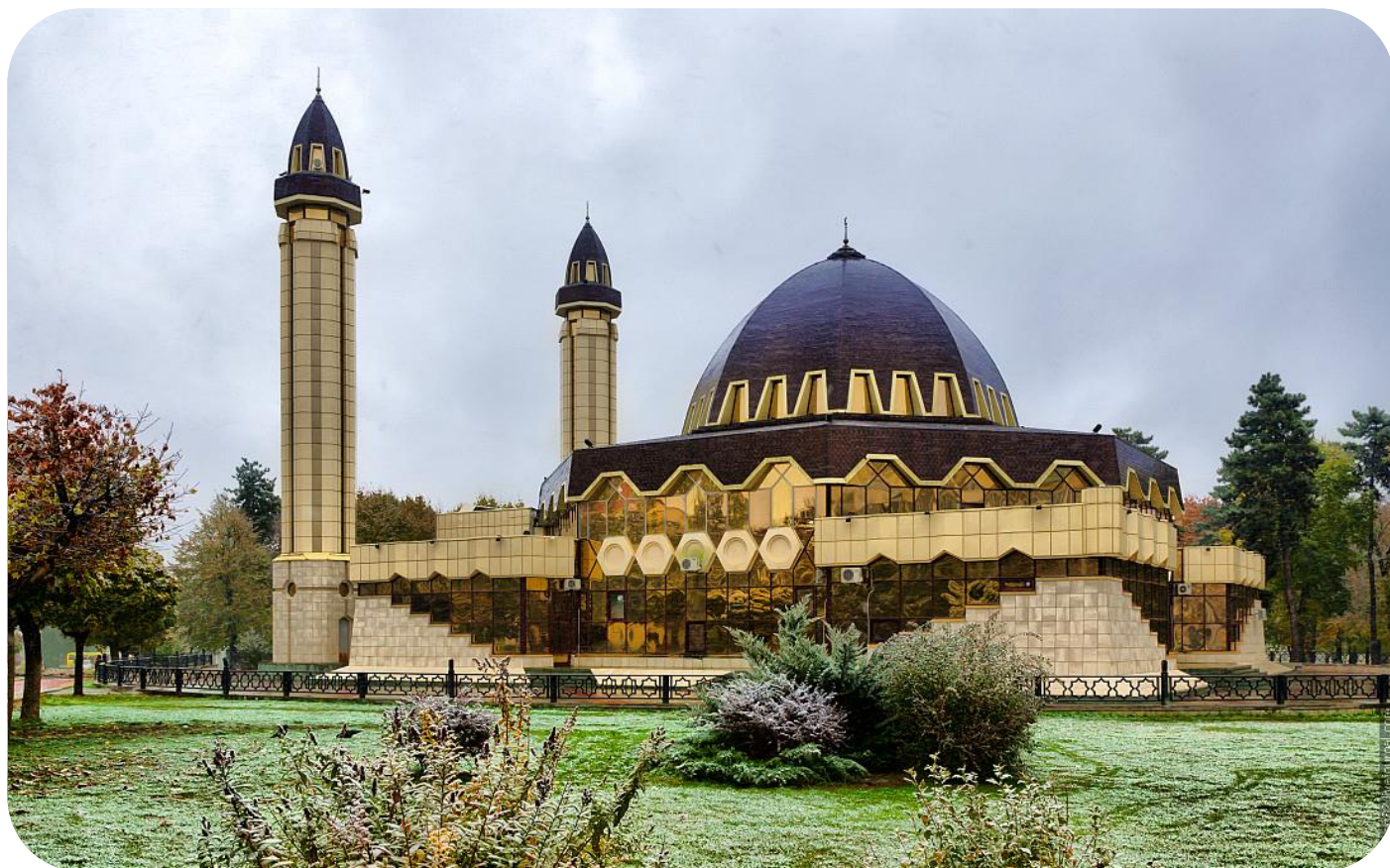
СХЕМА ТЕПЛОСНАБЖЕНИЯ Сельского поселения Второй Лескен Лескенского муниципального района Кабардино-Балкарской Республики